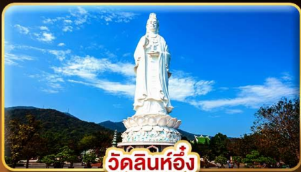
วัดลินห์อึ้ง